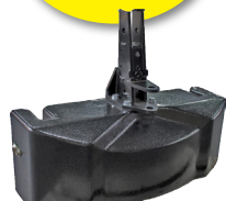
フロントウエイト (850kg)